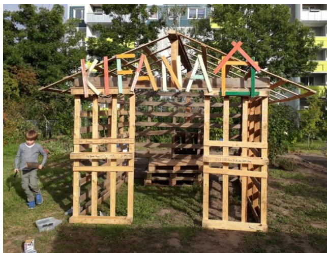
Budenbauwettbewerb – Bude

Wir freuen uns auf ein weiteres spannendes Jahr auf unserem Bauspielplatz KiFaNa!