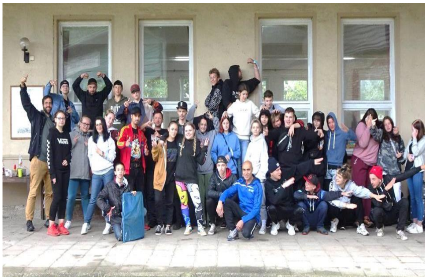
Hip-Hop-Camp in Stichelsdorf

Kindertreff, bei welchem neben Themen zur persönlichen Entwicklung oder des sozialen Miteinanders auch neue Partizipationsformen entwickelt werden. Wir sind gespannt, welche Vorschläge ein noch zu gründender Kinderrat für die weitere Arbeit hat.