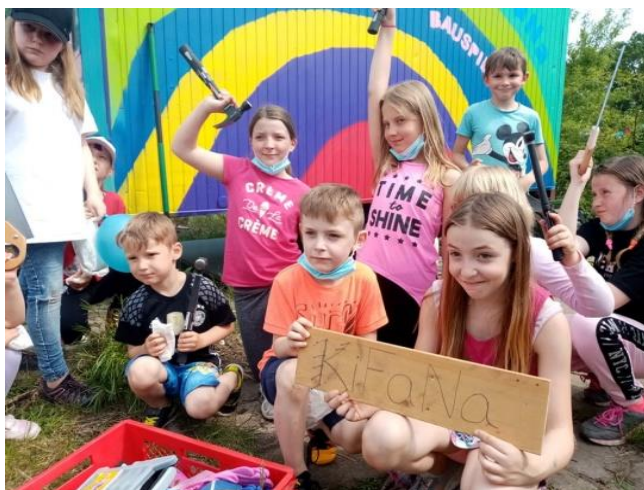
Eröffnung am 01.06.2021

Zur Eröffnung des Bauspielplatzes kamen viele Unterstützer*innen, interessierte Familien und auch schon etliche neugierige Kinder. Es wurde bei Knüppelkuchen und lustigen Spielen gefeiert und der erste Umgang mit Nagel, Hammer und Holz ausprobiert.